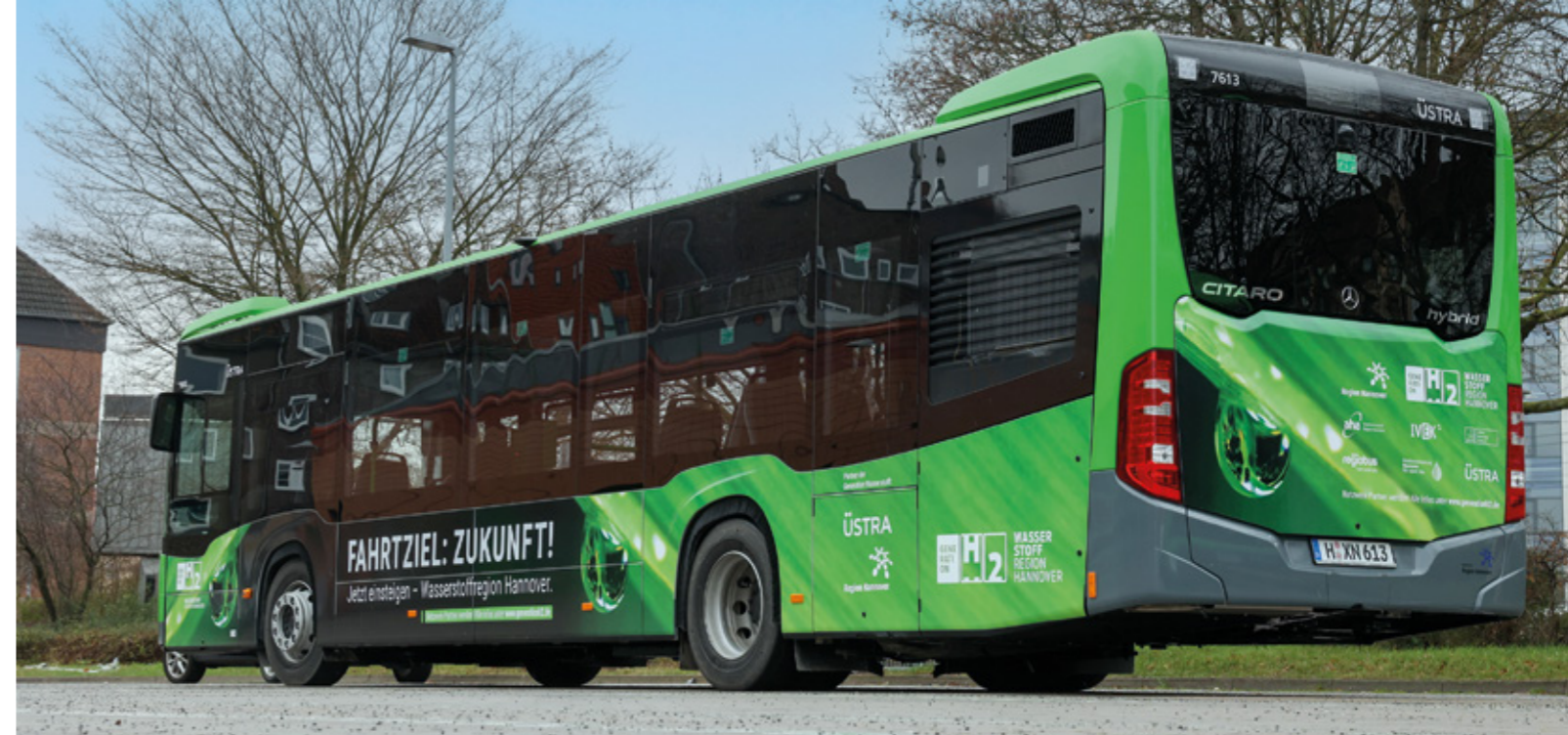
Der beklebte Bus macht auf das Thema Wasserstoff aufmerksam.