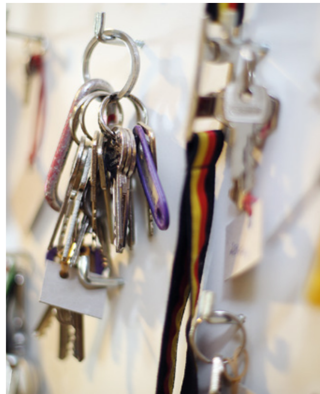
Das Fundbüro kommt nun aus einer Hand.