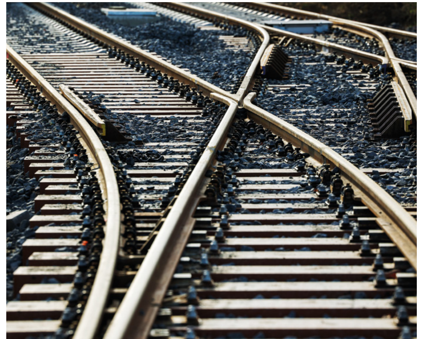
Dieses Jahr wird mit dem Streckenausbau nach Hemmingen ein Meilenstein im Stadtbahnnetz fertiggestellt.