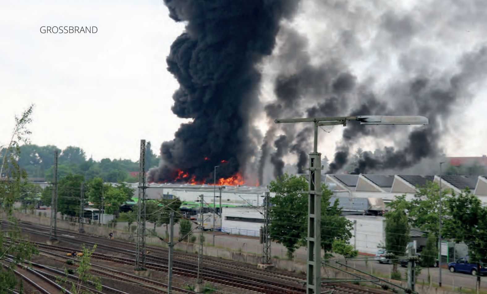
Die Rauchsäule über dem Betriebshof war weit über Hannover zu sehen.