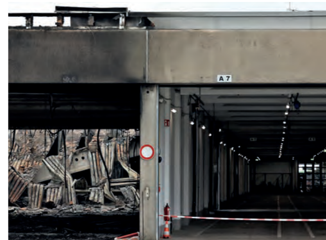
Durch die funktionierenden Brandschutzmaßnahmen konnte ein Übergreifen auf weitere Hallenteile verhindert werden.

Reisebus der Firma ÜSTRA Reisen wurde stark beschädigt. Außerdem zerstört wurden die Ladeinfrastruktur in der Bushalle und das Dach in diesem Bereich. Dass der Schaden nicht noch größer wurde, ist vor allem den vielen Mitarbeitern zu verdanken, die spontan ihre Dienste verlängert oder sich aus ihrer Freizeit heraus direkt auf dem Betriebshof gemeldet haben, um zu helfen und zu unterstützen. Nur so war es möglich, die stark gefährdeten übrigen Busse aus der Halle zu evakuieren. Die Bushalle ist nämlich durch Brandschutzwände unterteilt. Diese Brandschutzmaßnahmen haben – so die Feuerwehr – gut funktioniert, sodass durch die Tatkraft der Mitarbeiter der Schaden in Grenzen gehalten werden konnte.