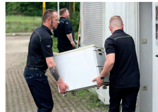
Beim kurzfristigen Umzug auf den provisorischen Betriebshof haben alle Mitarbeiter tatkräftig mit angefasst.

Sogar ein Teil der Buswerkstatt wurde auf dem provisorischen Betriebshof an der Messe eingerichtet. Ein Gelenkbus verwandelte sich kurzerhand zum Servicemobil, sodass kleinere Arbeiten direkt „auf Messe West 45“ erledigt werden können. Der Wechsel eines Abblendlichts oder der Austausch vom Wischwasser vor Fahrtbeginn sind somit gar kein Problem. Die „Werkstatt to go“ im Gelenkbus ist ein weiteres Beispiel für die Kreativität und den Ideenreichtum der ÜSTRA – auch während dieser Krise. Für die umfassenden Wartungsarbeiten und fürs Tanken müssen die Fahrzeuge allerdings nach wie vor auf den eigentlichen Betriebshof nach Mittelfeld. Die Werkstatt dort ist weiterhin zugänglich.