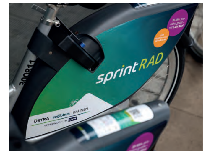
Ab sofort können Fahrgäste mit dem sprintRAD schnell und flexibel zur nächsten Stadtbahnhaltestelle fahren.